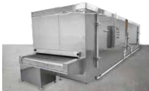
Túnel de congelación