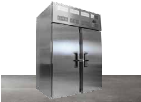
Congelador por lotes