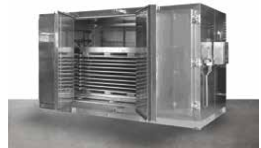
Armario de congelación en bloques